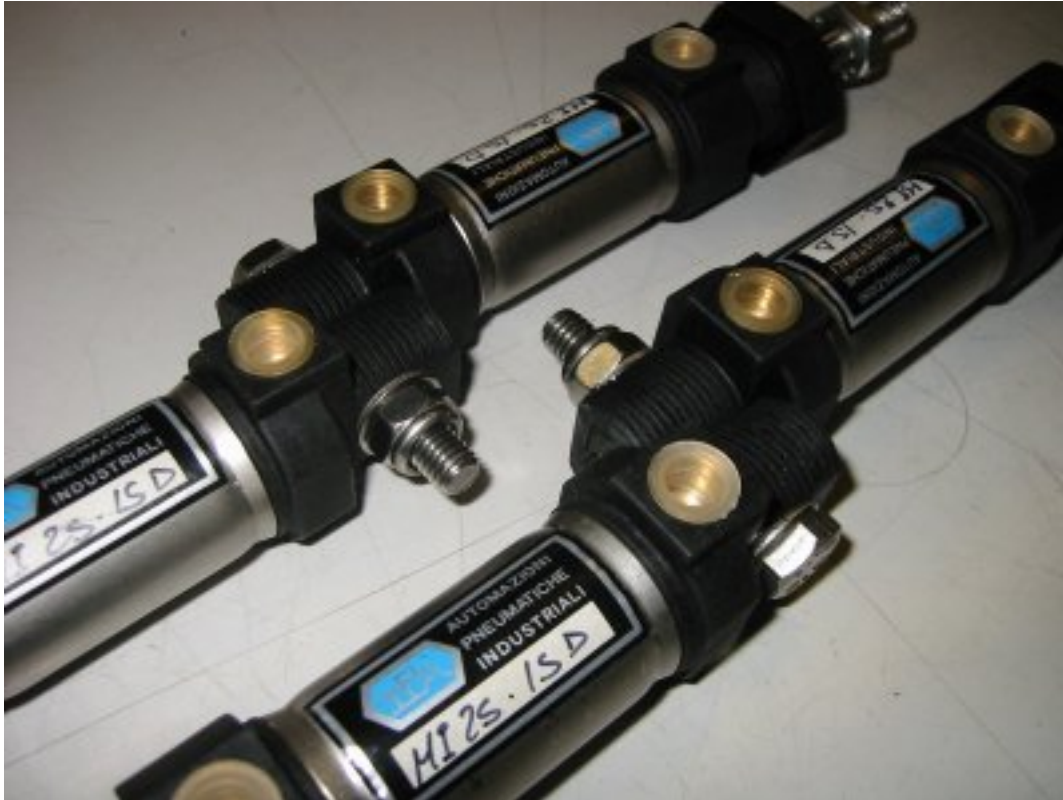
Sylinteri: 25mm halk. ja 16mm isk. pituus

Sylinterin perässä oleva kierreosa menee toisen kierreosan koneistuksen kanssa niin sopivasti vierekkäin, että paketti pysyy keskenään suorassa, eikä pääse liitoksen kohdalta ”taipumaan”. Muutapa ei sitten tarvinnutkaan, kuin 8 mm pultti ja mutteri.